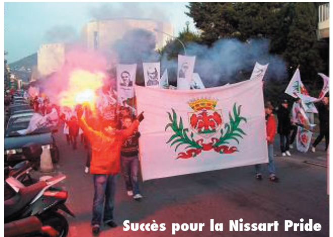
Succès pour la Nissart Pride

Alertés par des riverains, les Identitaires ont procédé au nettoyage d'un parc