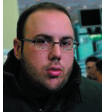
PAR PHILIPPE VARDON PORTE-PAROLE DE NISSA REBELA